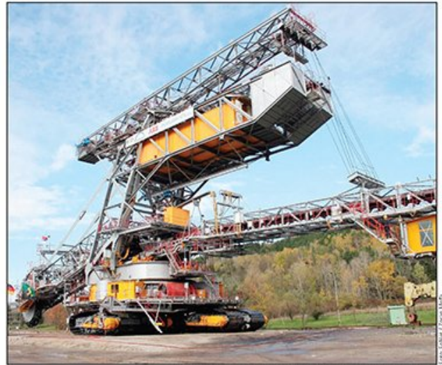
Već dugo nema novih kapaciteta: Rotacioni bager na kopu Tamnava