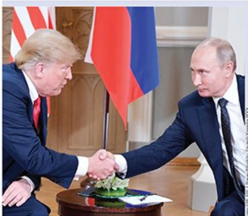
Obojica odlagali dolazak na samit: Donald Tramp i Vladimir Putin

U Helsinkiju razgovarali lideri SAD i Rusije