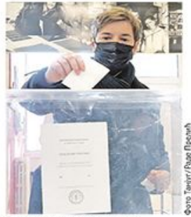
Ана Брнбајић јуче на гласању

ISSN 0350-4305 ЦРНА ГОРА 0,70 ЕУРО; РЕПУБЛИКА СРПСКА 1 КМ; ХРВАТСКА 0,80 ЕУРО; МАКЕДОНСКА 3,00 ЕУРО; СЛОВЕНИЈА 1,20 ЕУРО; ОИД: 64х1 КМ