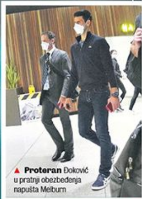
▲ Proteran Đoković u pratnji obezbeđenja napušta Melburn

Vučić: Videli smo šikaniranje i gomilu laži tužioca! Ovo je bio lov na vestice