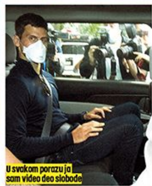
U svakom porazu ja sam video deo slobode

” ŽELEO BIH DA ZAHVALIM SVOJOJ PORODICI, PRIJATELJIMA, TIMU, NAVIJAČIMA I MOJIM ZEMLJACIMA SRBIMA NA STALNOJ PODRŠCI. SVI STE MI BILI VELIKI IZVOR SNAGE