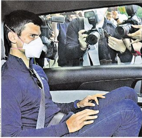
Најбољи тенисер света напустио је јуче Аустралију летом за Дубаи