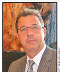
Serž Bramerc, glavni tužilac Haškog tribunala, govori za Danas