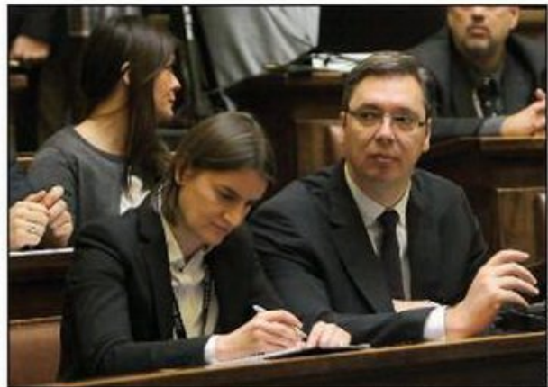
Povećanje plata manje tamo gde politika jače kontroliše zaposlene: Premijerka Brnabić i predsednik Vučić

Beograd - Najvećom premijerke Ane Brnabić da će plate u javnom sektoru od 1. januara 2018. biti povećane za 10 odsto zaposlenima u školstvu, zdravstvu, vojsci, policiji, zaposlenima u sudovima i tužilaštvima, zavodima za izvršenje krivičnih sankcija, ustanovama kulture i Poreskoj upravi, a za pet odsto zaposlenima u administraciji, ministarstvima i Skupštini, Vlada Srbije je oglašila o preporuke Fiskalnog saveta da ne bi smela ići iznad pet odsto koliko je planiran nominalni rast BDP-a. Iz toga sledi skok povećanje plata od 10 odsto je očekivano - obzirom na to da je nedavno i minimalna zarada za toliko povećana, ali prema rečima predsednika Ujedinjenih građanskih sindikata Nerazumno je Zorana Stojiljkovića, to nas i dalje drži na evropskom dnu po visini plata.