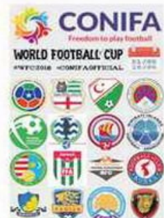
Грбови учесника Конифиног светског првенства 2018.

У Лондону ће се, наредне године, ипак играти светско првенство у фудбалу, али – репрезентација не-признатих држава, народа, мањина и региона, са условом да их Фифа није прихватила.