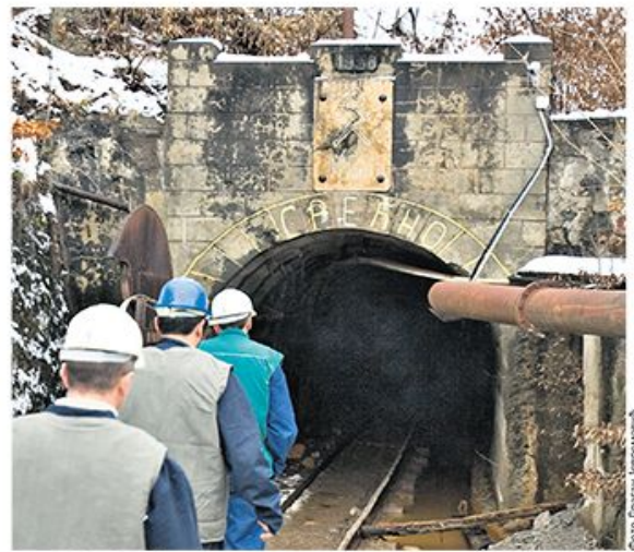
Рудник „Леце“ код Медвеђе

Свевиши се потрудио да Србија испод земље остави поприлично богатство. Уз све резерве према оптимистичким проценама власти, чак и њени највећи економски критичари слажу се да Срби ходеју изнад око 200 милијарди долара новца у рудма. Међутим, дајући то Србија, Свевиши се потрудио и да многи од њих помисле како је копање баваља работа. Шта би тек било да имамо нафту попут Емираћана, који су од бедуина на камилама постали бедуини у „роле-ројевима“ типа „фантом“, који крстаре Дубајем, некадашњим рибарским сеоцетом и сиромашном луком на ободу пустиње? Вило је такво до средине шездесетих година прошлог века, док није откривена нафта. Камиле су, колико ми је познато, преживеле бушотине. Нико их од шенка није напајао дизелом. стране 11, 12 и 13