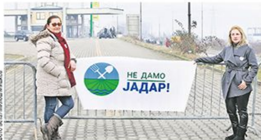
Блокада пута код граничног прелазу Трбушница код Лознице