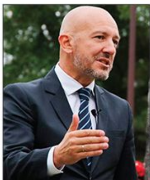
Predsednik Srbije ponovo vredao sudiju Apelacionog suda u Beogradu