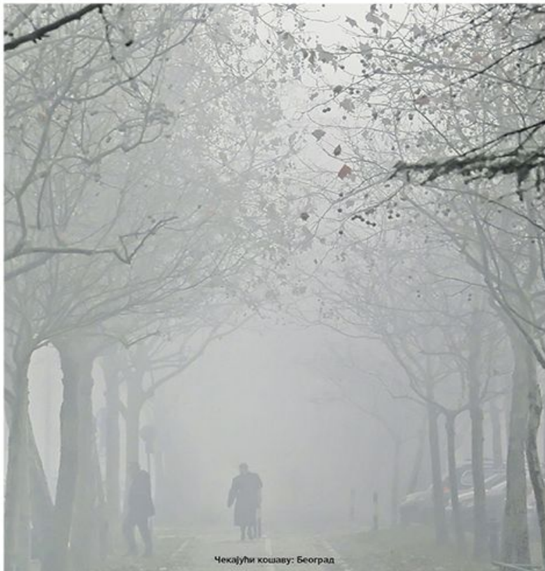
Чекајући кошању: Београд