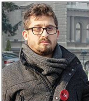
Aktivista udruženja „1 od 5 miliona“ identifikovao napadača koji ga je davio na protestu u novembru

Marković: Čovek koji me je napao radi u BIA