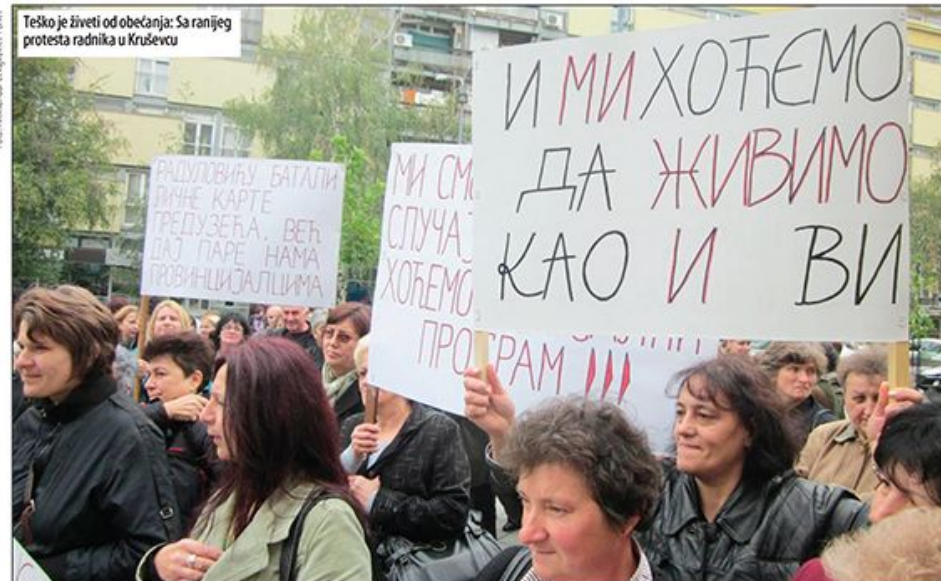
Teško je živeti od obećanja: Sa ranijeg protesta radnika u Kruševcu

■ Miljko Arsić: Rast plata iznad rasta BDP-a i produktivnosti, a produktivnost je ključna veličina ovde, doveo bi do pada konkurentnosti naše ekonomije. Uz to, plan podrazumeva fiksni kurs, odnosno relativno jačanje dinara prema evru