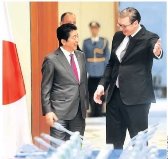
Шинзо Абе и Александар Вучић