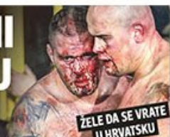
ZELE DA SE VRATE U HRVATSKU