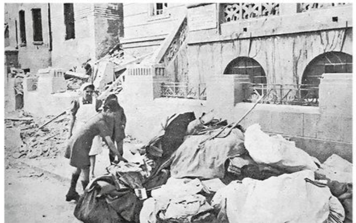
Разорено породилиште „Краљице Марије“, данашња Студентска поликлиника у Крунској улици