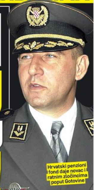
Hrvatski penzioni fond daje novac i ratnim zločincima poput Gotovine

Najveća sportska dvorana na Balkanu od oktobra mogla bi da se zove Atlantik arena, po glavnom sponzoru „Atlantik grupi“, čiji je suvlasnik hrvatski penzioni fond