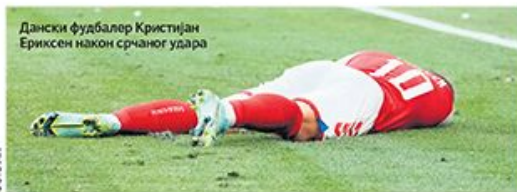
Дански фудбалер Кристијан Ериксен након срчаног удара