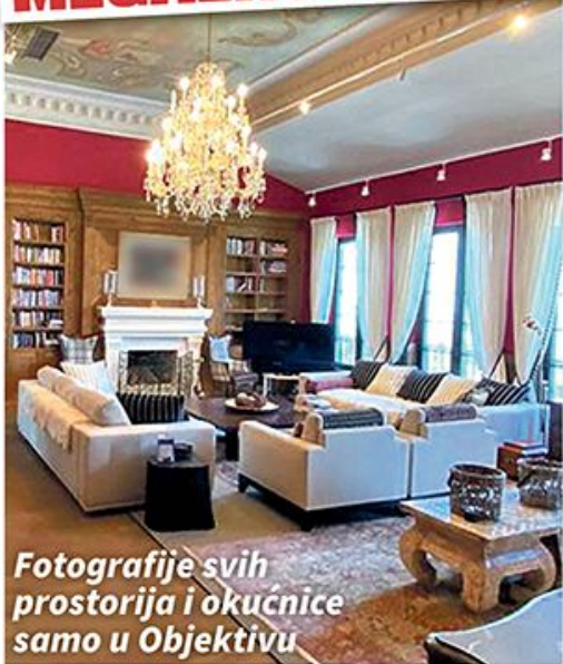
Fotografije svih prostorija i okućnice samo u Objektivu