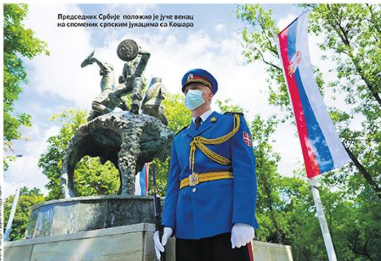
Председник Србије положио је јуче венац на споменик српским јунацима са Кошара