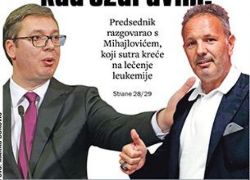
Predsjednik razgovarao s Mihajlovićem, koji sutra kreće na lečenje leukemije

Vučić: Miho, ti si borac, pobeđićeš! Siniša: Pijemo dunju kad ozdravim!