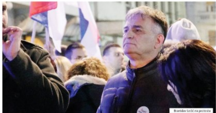
Branislav Lečić na protestu

Lečić: Nova „plišana revolucija“ je počela