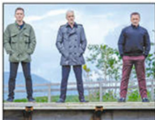
Povodom beogradske premijere „T2 Trejnspotinga“