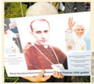
Završen sastanak mešovite katoličko-pravoslavne komisije u Novom Sadu