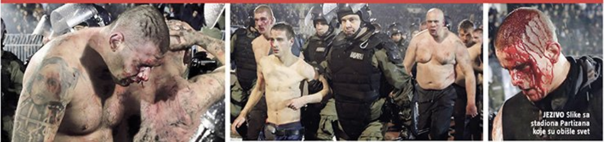
JEZIVO Slike sa stadiona Partizana koje su obišle svet