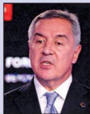
Bivši lideri Hrvatske i Crne Gore u Beogradu na javnom snimanju emisije „Okruženje“

Đukanović: Nismo pretnja već smo na „liniji vatre“