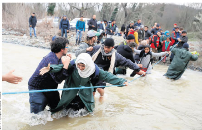
Грчко-македонска граница 14. марта ове године – мигранти прелазе реку

На захтев Атине, „Фронтекс“ у јануару покреће две операције: контролу пасоша и кретања миграната дуж северне границе Грчке