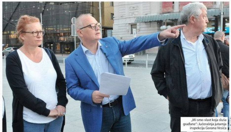
„Mi smo vlast koja sluša građane“: Jučerašnja jutarnja inspekcija Gorana Vesića