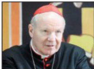
Bečki kardinal Kristof Štefanić govori za Danas povodom 100. godišnjice od Prvog svetskog rata

Rat protiv Srbije bio je tragični potez cara Franca Jozefa