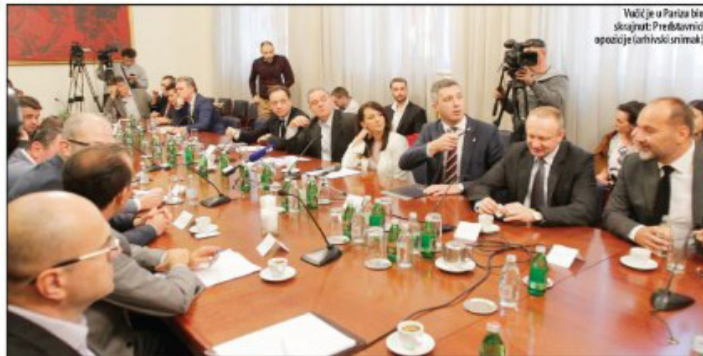
Vučić je u Parizu bio skroz crn: Predstavnici opozicije (arhivski snimci)