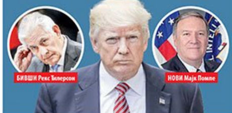
БИВШИ Рекс Тилерсон

■ ШЕФ ЦИА НОВИ ДРЖАВНИ СЕКРЕТАР СТРАНА 9.