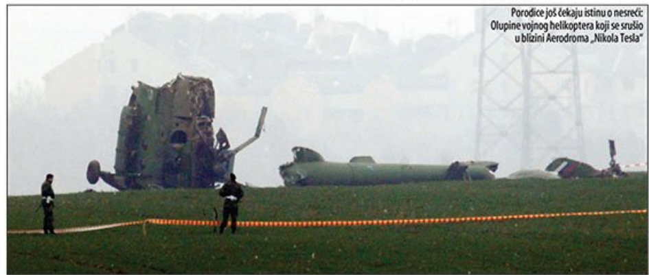
Porodice još čekaju istinu o nesreći: Olupe vojnog helikoptera koji se srušio u blizini Aerodroma „Nikola Tesla“