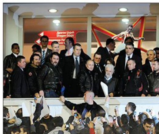
Ruski bajkleri 19. marta stižu u Beograd u okviru devetodnevne turneje „Ruski Balkan“

Putinovi „Noćni vukovi“ ponovo na Marakani?