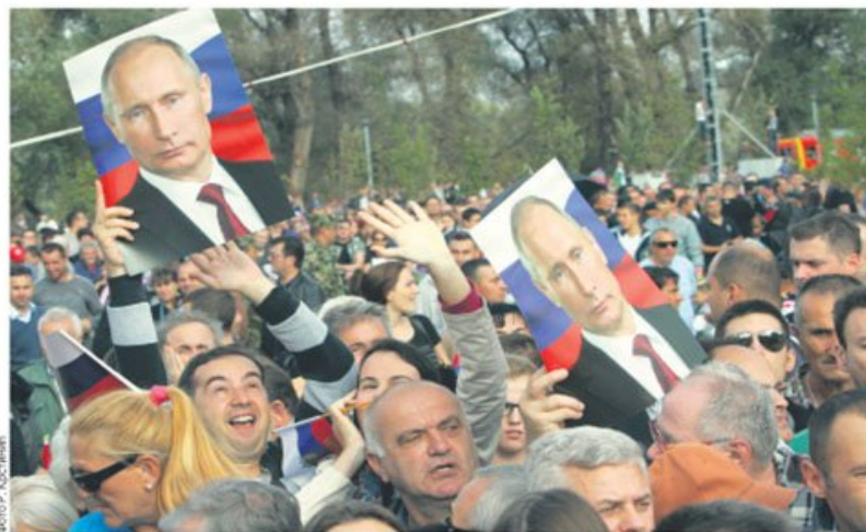
Овацје за Владимира Путина пред војну параду у Београду 2014. године