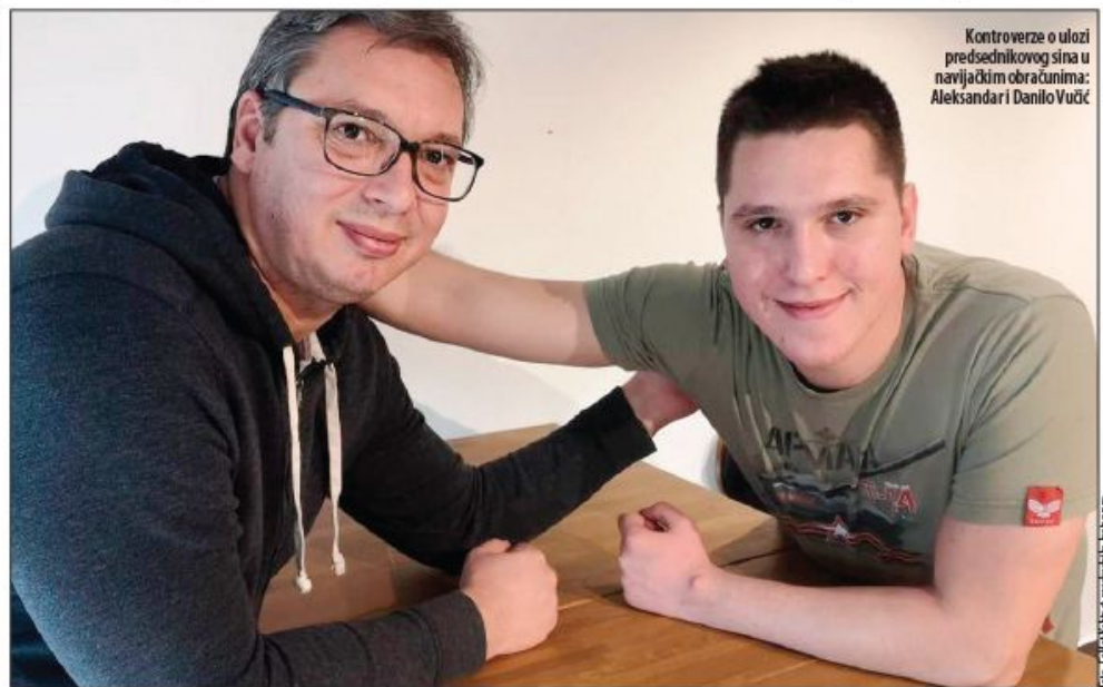
Kontroverze o ulozi predsednikovog sina u navijačkim obračunima: Aleksandar i Danilo Vučić