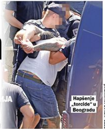
Hapšenje „torcida“ u Beogradu