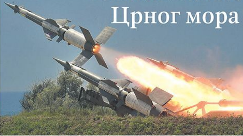
Овај систем оборио је „невидљиво“ 1999. године: лансирање ракете „нева“

На полигону Шабла српски пилоти су испалили три ракете, а јединице ПВО четири „неве“ и четири „куба“