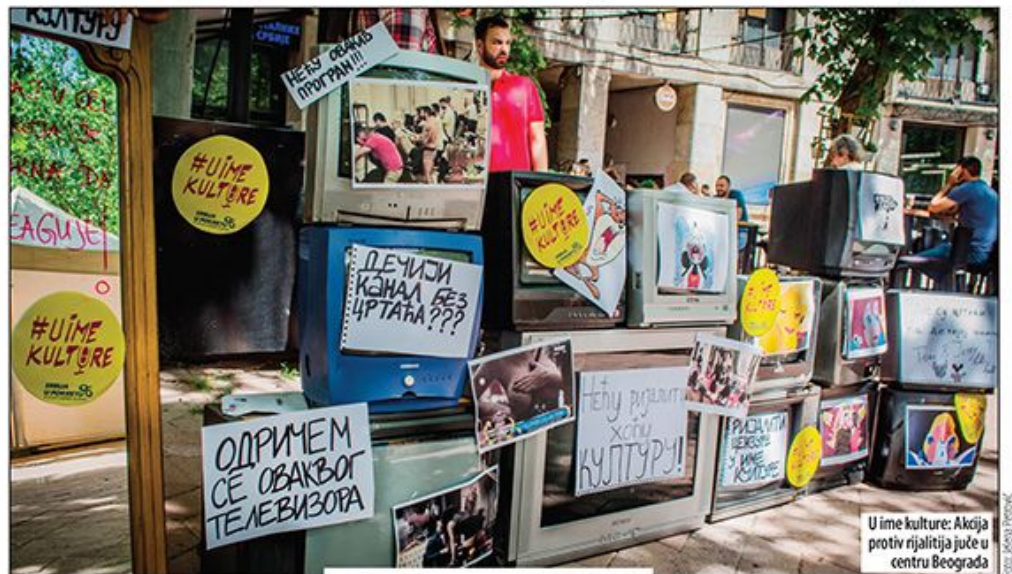
U ime kulture: Akcija protiv rijalitija juče u centru Beograda

Ispred REM-a pokrenuto skupljanje potpisa za zakon kojim će se ograničiti rijaliti programi na televizijama sa nacionalnom frekvencijom