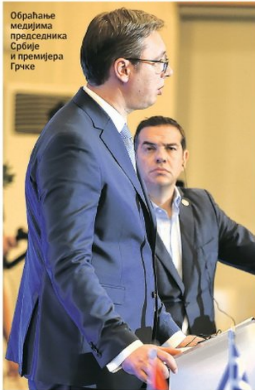
Обраћање медијима председника Србије и премијера Грчке