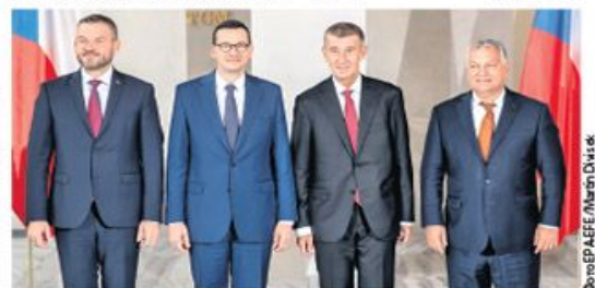
Премијери Словачке, Пољске, Чешке и Мађарске јуче у Прагу: Петер Пелегрини, Матејуш Моравецки, Андреј Бабиш и Виктор Орбан