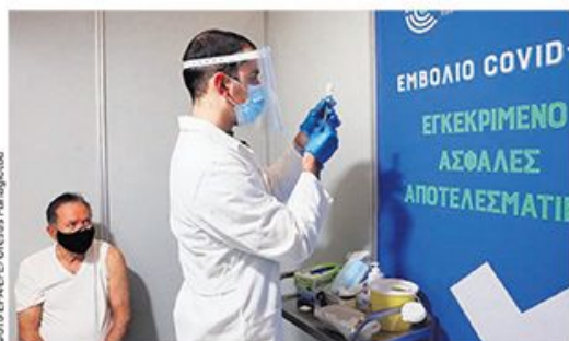
Вакцинација у Атини