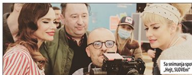
Sa snimanja spota „Hejt, SLOVEni“