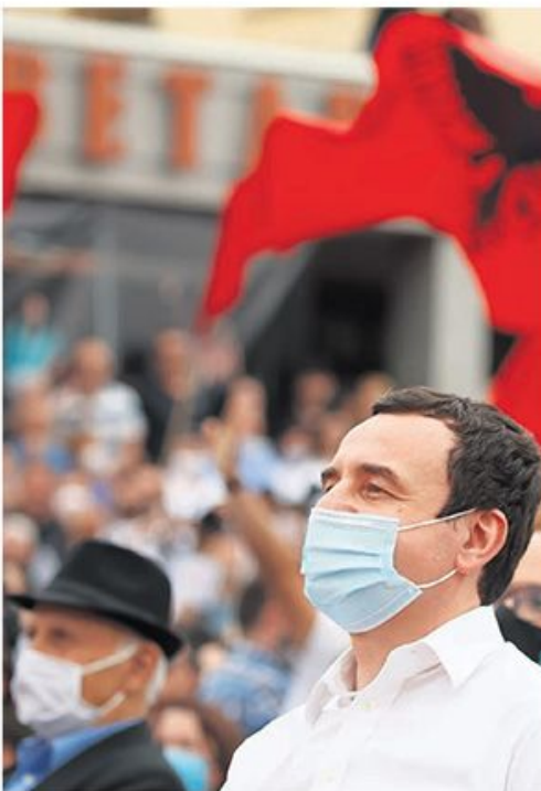
Курти не може да уведе реципрочне мере без договора са САД и ЕУ