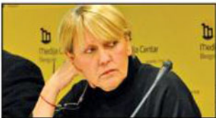
Zatražena smena u regulatornom tela nije dovoljna

Godišnji medijski budžet otišao televiziji Kopernikus Strana 10