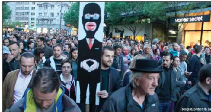
Beograd, protest 10. dan

■ Još je rano da se razmišlja o pregovorima sa Vučićem, ali i o tome da zahteve studenata u Skupštini zastupa opozicija ■ Protesti nastavljani i juče, desetog dana ■ Naprednjaci dobili nalog da se spremaju za kontramiting ■ Maja Kocijančić: Pratimo događanja u Srbiji ■ Protest Inicijative „Ne da(vi)mo Beograd“ 25. aprila