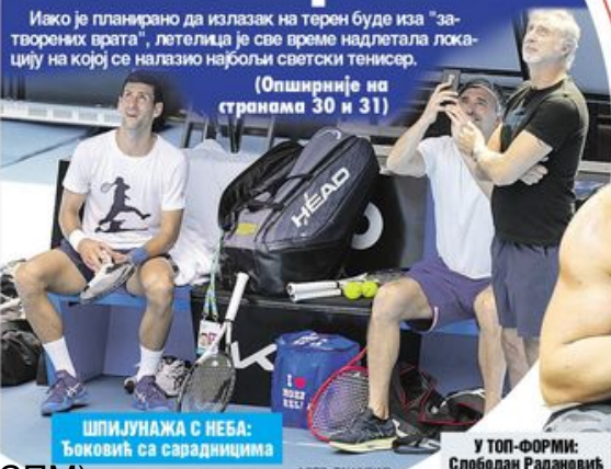
ШПИЈУНАЖА С НЕБА: Ђоковић са сарадницима