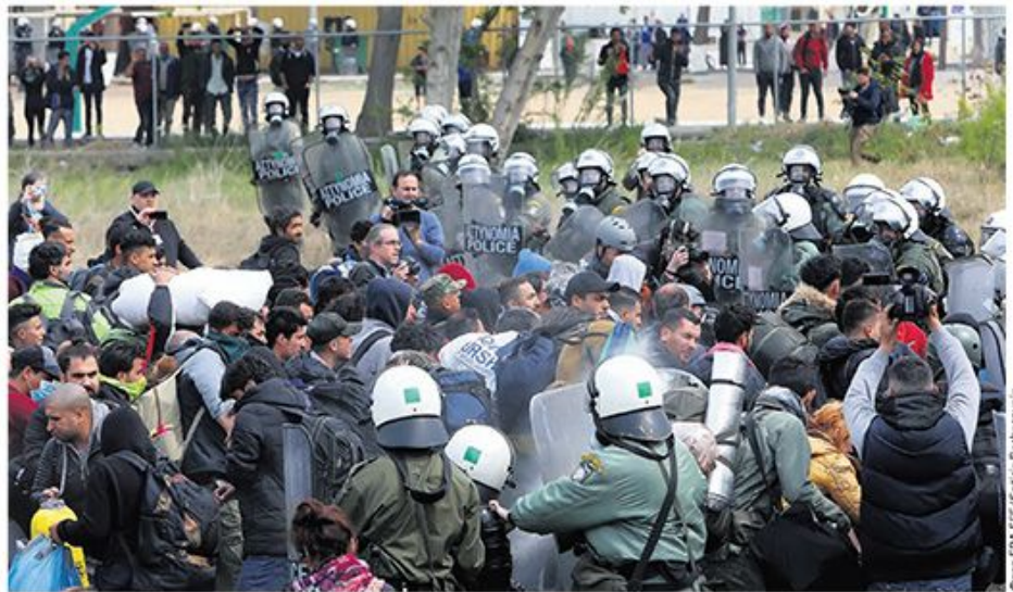
Сукоб миграната и полиције у кампу у близини Солуна прошле године