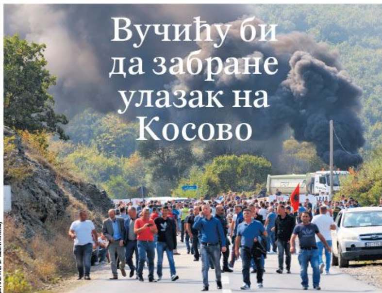
Демонстрације Албанаца приликом посете Александра Вучића Косову и Метохији септембра 2018.

ЦЕНА ПОСРЕДСТВОМ РЕПУБЛИКЕ СРПСКЕ 1 КМ; ОПШТИНА БЕОГРАД; ИМПОРТОРА 30,00 ДИН; СЛОВЕНИЈА 1,00 ДИН; ОСД, Београд, 2019.