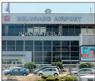
Za prvih devet meseci Vansi uplatio 3,2 miliona evra, ali dobit „Nikole Tesle“ svega 650.000 evra

Troškovi jedu prihod od koncesije za aerodrom