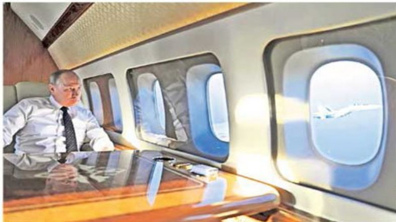
Авион председника Путина јуче су руски ловци допратили до базе Хмејмим у Сирији