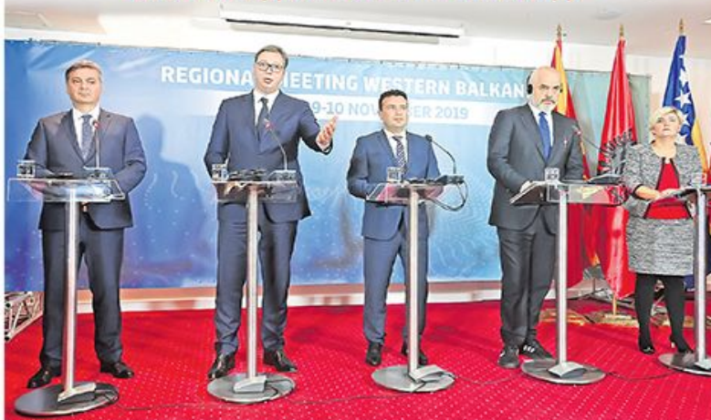
Председавајући Савета министара БиХ Денис Звондџић, председник Србије Александар Вучић, премијер Северне Македоније Зоран Заев, премијер Албаније Еди Рама и министарка економије Црне Горе Драгица Секулић