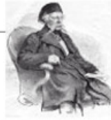
Срби сви и свуда

Срби неће дати свој глас за војску Косова стр. 6