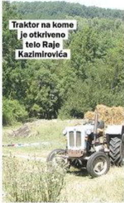
Traktor na kome je otkriveno telo Raje Kazimirovića

ALO! U JABUKOVCU Ubijena porodica pronađena tek nakon dva dana