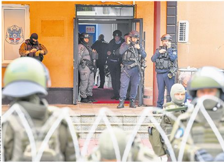
Припадници Кфора обезбеђују наоружане косовске специјалце у згради Општине Звечан