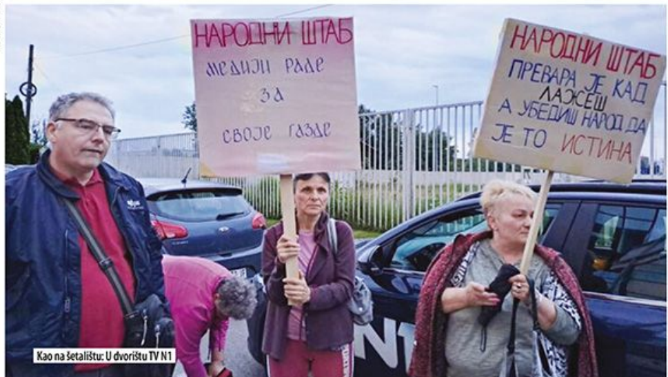
Kao na šetalištu: U dvorištu TV N1