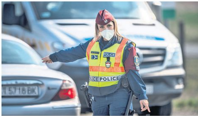
Полицајка на мађарској граници

Битно мерило да се нека држава стави на листу безбедних земаља било је да је у њој епидемиолошка ситуација врло слична или боља него у самој Европској унији