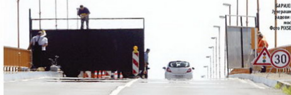
БАРЈЕЛА Дугорачице радови на мосту

■ ЗАГРЕБ ПОТЕЗ ОБРАЗЛОЖИО НАЈЕЗДОМ МИГРАНАТА КОЈЕ НИКО НИЈЕ ВИДЕО