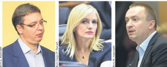
Александар Вучић тврди за „Политику“ да ниједан тајку не финансира рад напредњаци и да ова партија нема црне фондове