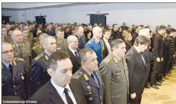
Sa komemoracije žrtvama

Takođe je utvrđeno da je ministar odbrane Bratislav Gašić dostavio 13. marta 2015. godine zahtev (19,26 časova) brigadnom generalu Predragu Bandiću da se razmotri mogućnost hitnog sanitetskog prevoženja helikoptrom životno ugroženog deteta iz