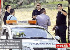
ПОСТУПАК Београда који је била актор Док објави на твитеру