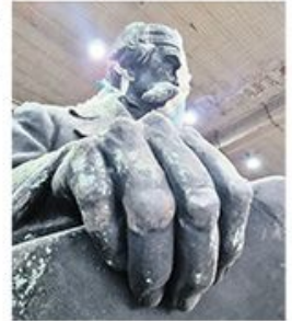
Споменик Вуку очишћен од патине и чађи стр. 16