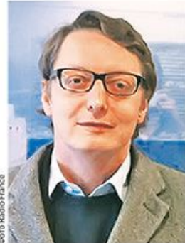
ИНТЕРВЈУ: МИШЕЛ ЕЛЧАНИНОВ, француски филозоф