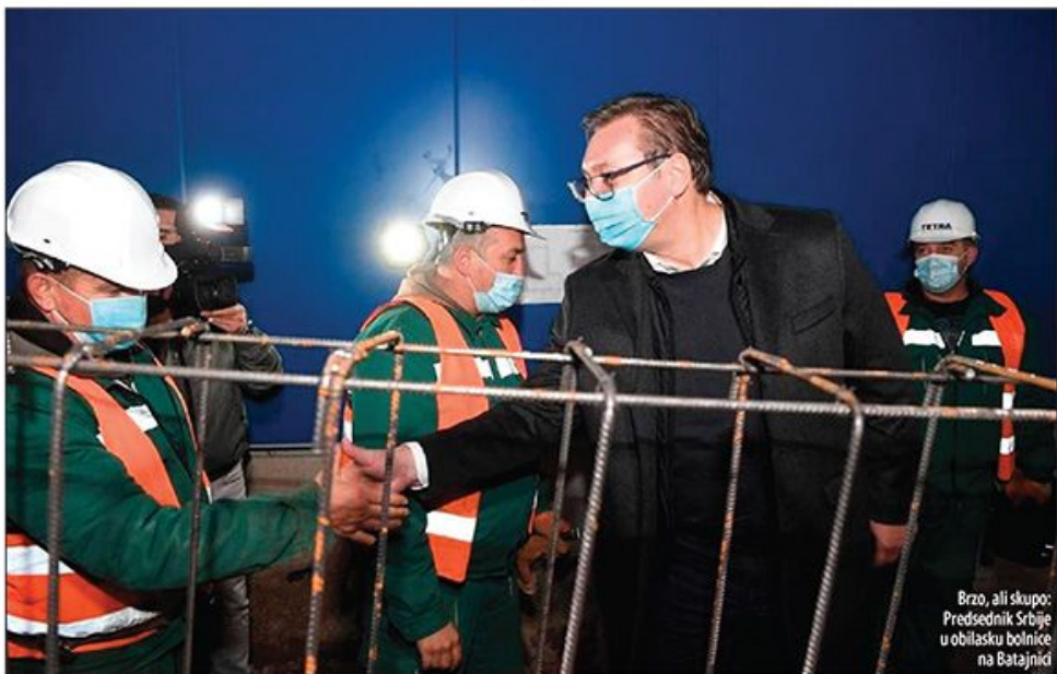
Brzo, ali skupo: Predsednik Srbije u obilasku bolnice na Batajnici

■ Građevinski stručnjaci zbunjeni izrazito visokom cenom – kruševačka košta 1.200, a batajnička 2.000 evra po kvadratu