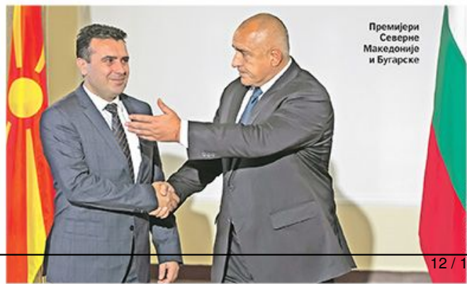
Примијери Северне Македоније и Бугарске

Бојко Борисов, некадашњи боксер, своје ударце из спорта пренео је у политички ринг