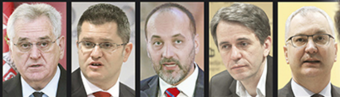
NA ISTOM ZADATKU Tomislav Nikolić, Vuk Jeremić, Saša Janković, Saša Radulović i Dragan Šutanovac

Istina je, svi su se ujedinili da mu skinu glavu