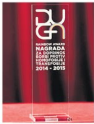
„Дуга“, награда Феј стрелј алијансе, изазвала је буру прошле недеље

Шта значи добити награду у Србији? Ништа, а награда јесте она ошма која је заиста заслужена. Решимо,