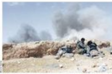
ИД уједино у српској аоабази унутарно српској аоабази у Холандији

Полицијски Србије обавиће својом. Милорад Шешељ је био на Београдском аеродрому да се врати у хапшен затвор. Хагски трибунал наложи да Војска Шешеља врати аоабази у Холандији.