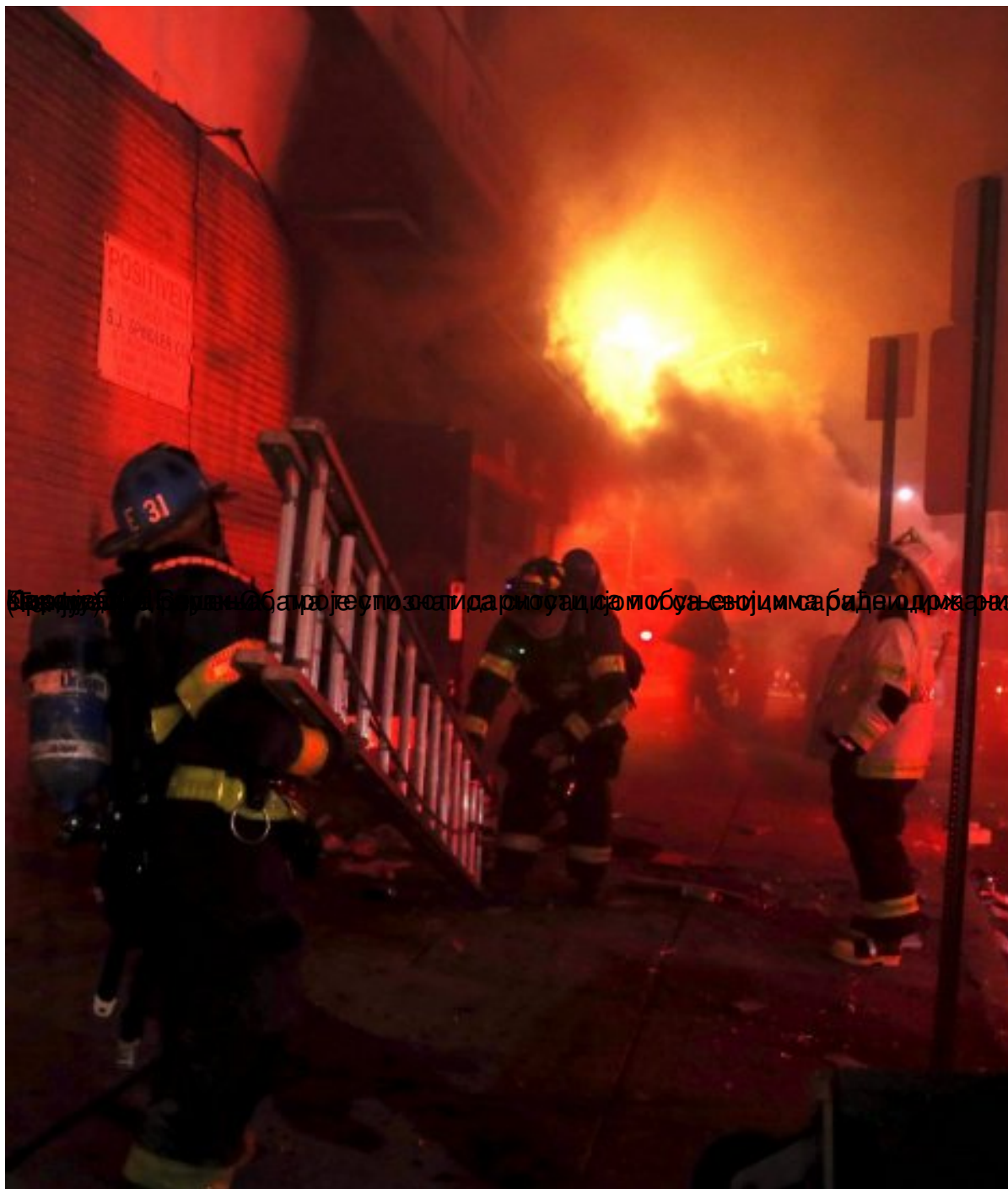
Борба са пожаром је у затишју након што су се возачи аутомобила са својим сабијеним аутомобилима одвајали од места након смрти 25-годишњег афроамериканца у затвору, нови немири и ванредно стање у Мериленду, уторак, 28 април 2015 09:06