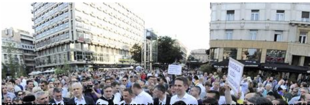
Милорад Павић, бивши председник Српске радикалне странке, који је био један од организатора протеста