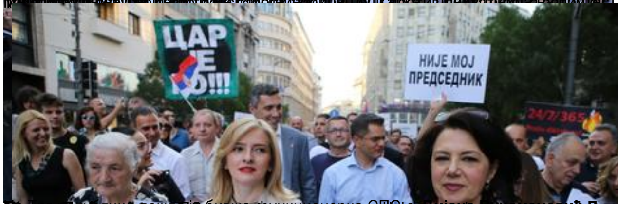
Зорана Ђинђић, бивши председник Српске радикалне странке, која је била једна од организатора протеста