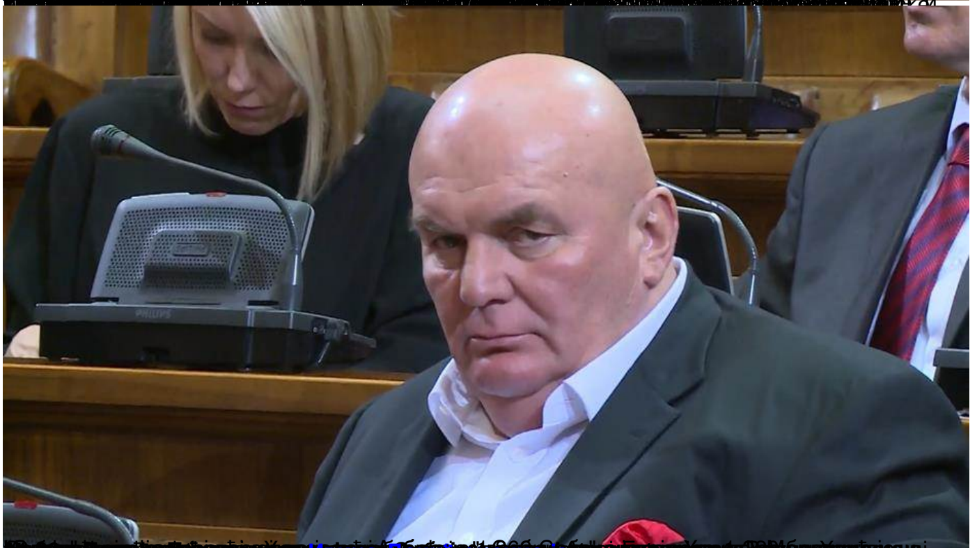
Датум: 05.08.2019. 17:00:00. Место: Крушедол.