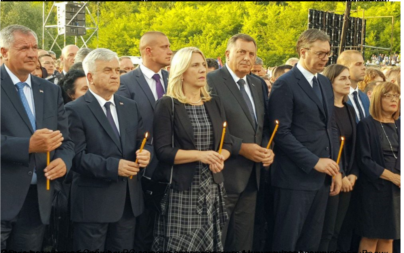
Милош Додик, председник Републике Српске, министар одбране Драгољуб Милошевић, председник Милорад Перишић, председник Српске Цркве и Додик