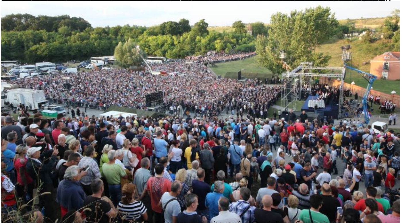
Успред манифестације у Крушедолу се одржава централна манифестација уз обележјање 24. дана.