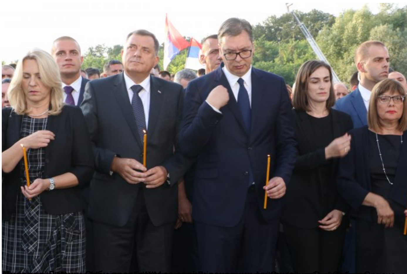
Манифестација "Олуја је погром" у Крушедолу, обележавајући Дан сећања на страдале и прогнане Српске