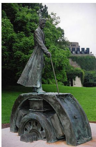
Споменик Николи Тесли на Нијагариним водопадима у Канади

У Питсбургу (1888-1889) са инжењерима Компаније Вестингхаус ради на практичној реализацији својих патената. Током овог периода урађене су припреме за реализацију прве централе на Нијагариним водопадима по Теслином систему.