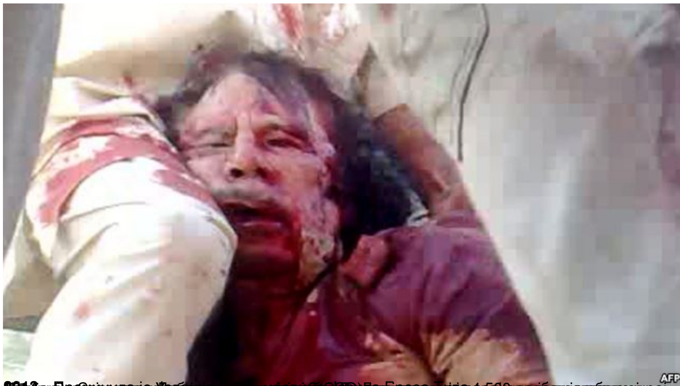
2013 год. Према фотографији из архива државне телевизије Србије, након бомбардовања Ниша 1943. године, повређени грађанин је са својим савезницима одведен у болницу.