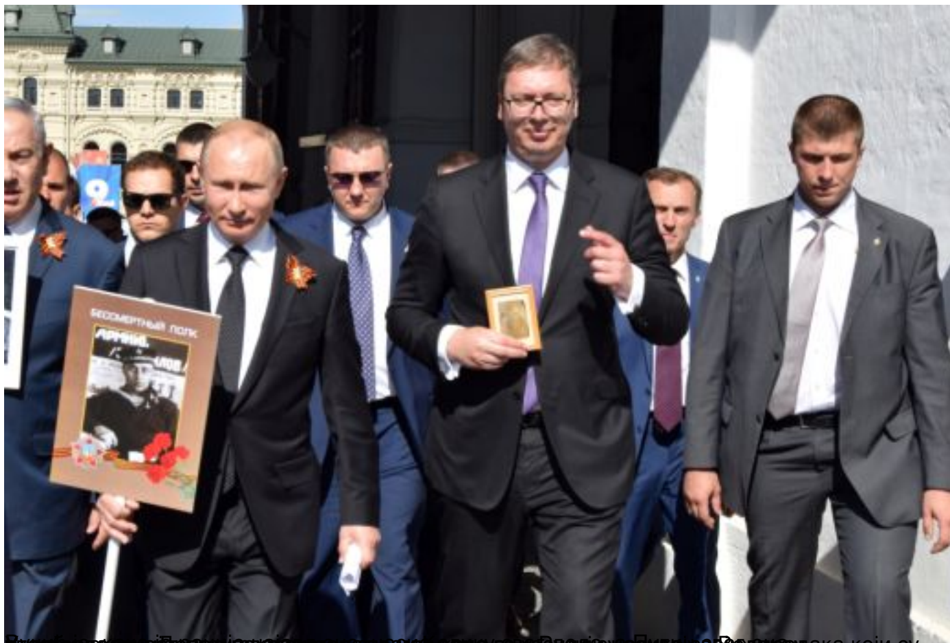
Учесници марша носили су слике својих предака који су учествовали у Другом светском рату.