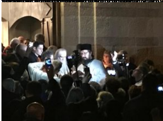
Свабодна штампа и медији су у стању да објаве информације о свим сабрањима,