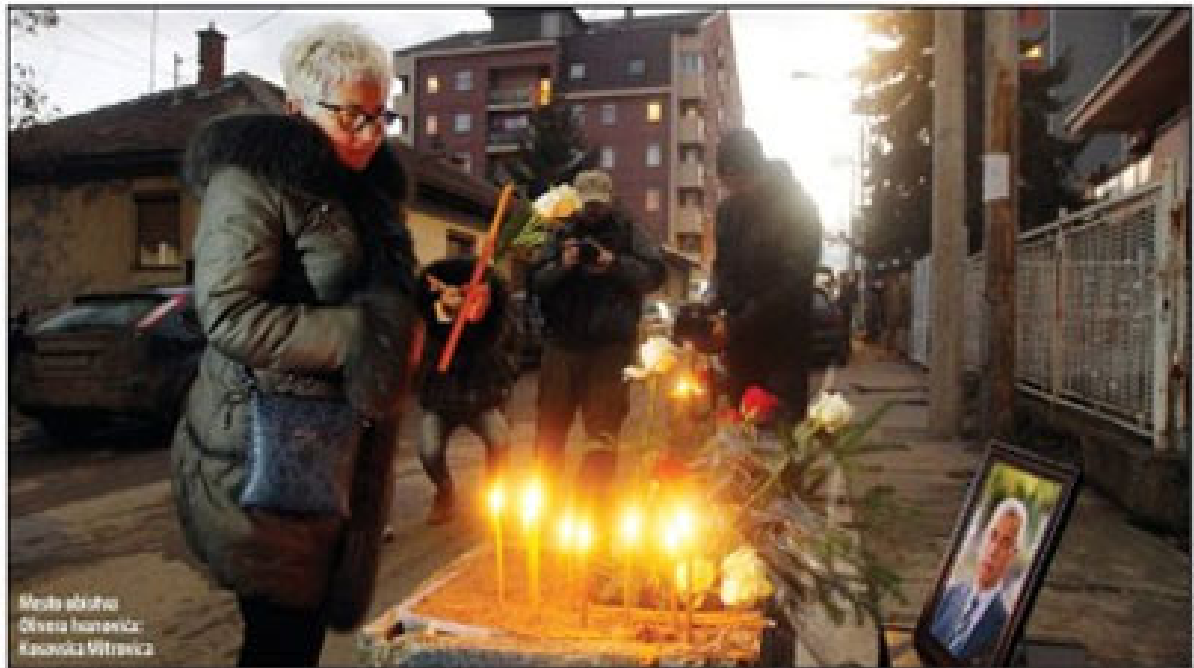
Mesto ubistva Olivera Ivanovića Kosovka Mitrovica