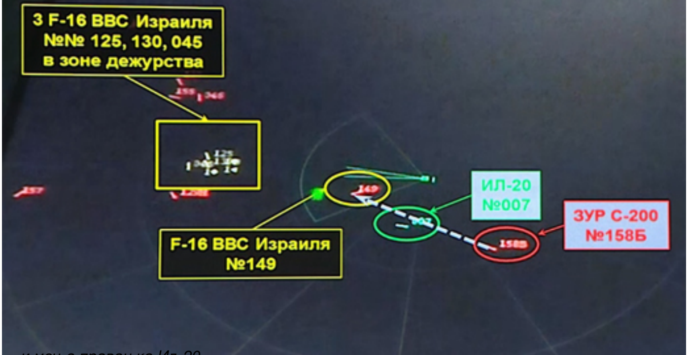
... и мења правац ка Ил-20...