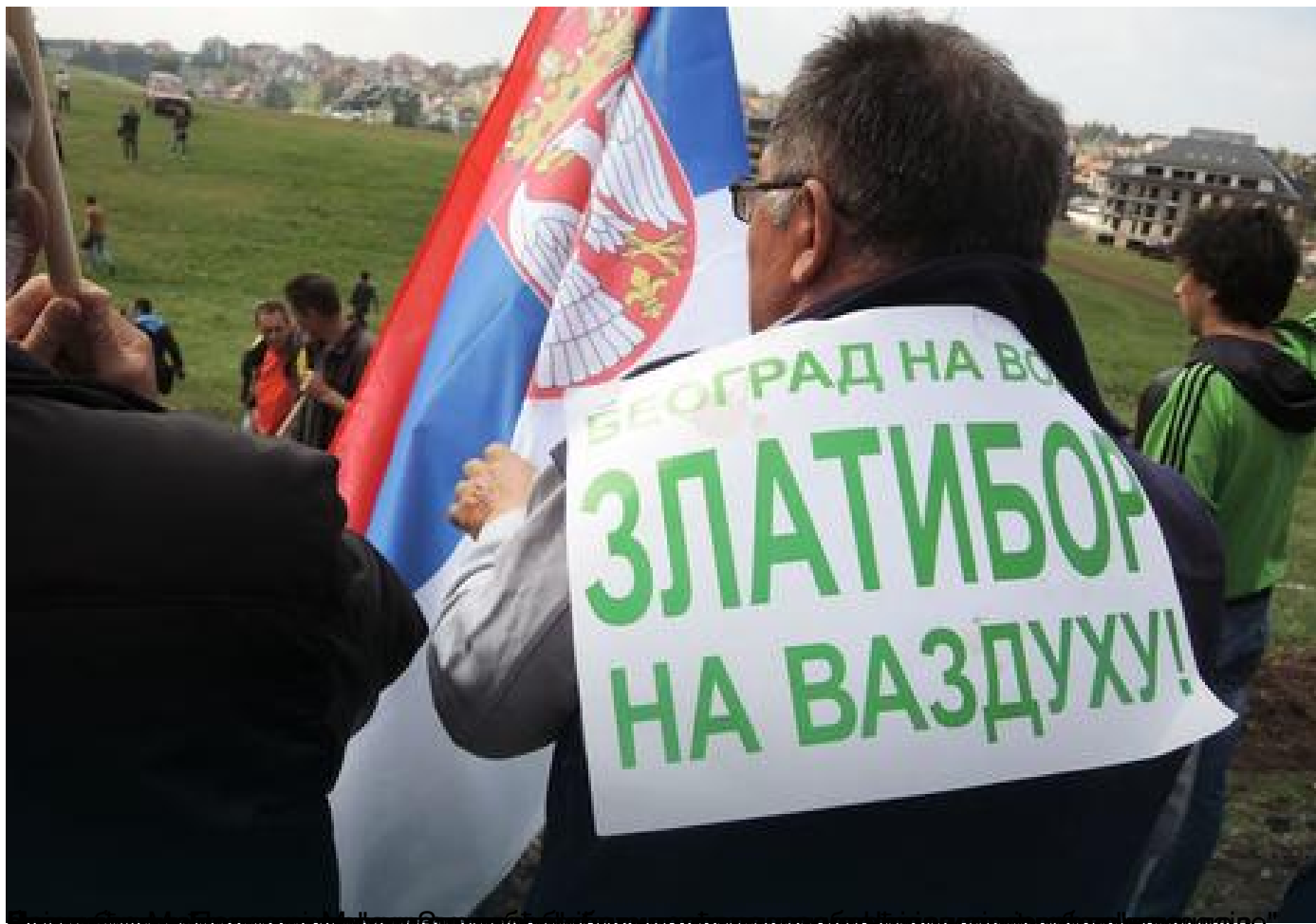
Стаматовић и златиборци протестују испред Владе Србије.