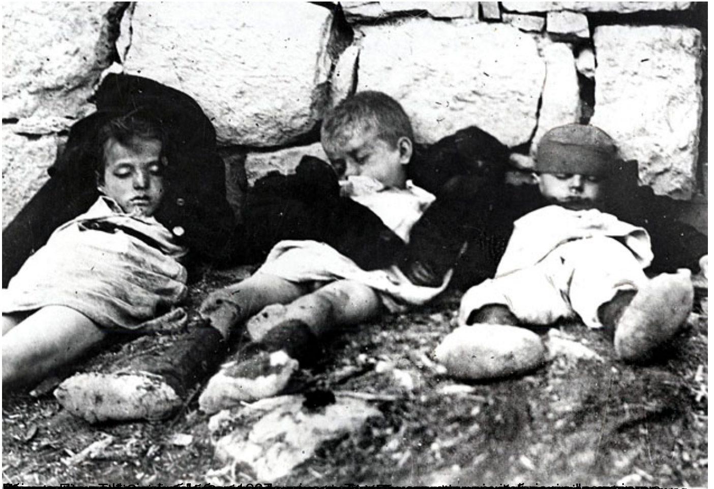
Менахем Розензафт: Кад је реч о геноциду почињеном у Другом светском рату, Хрватска је категорија