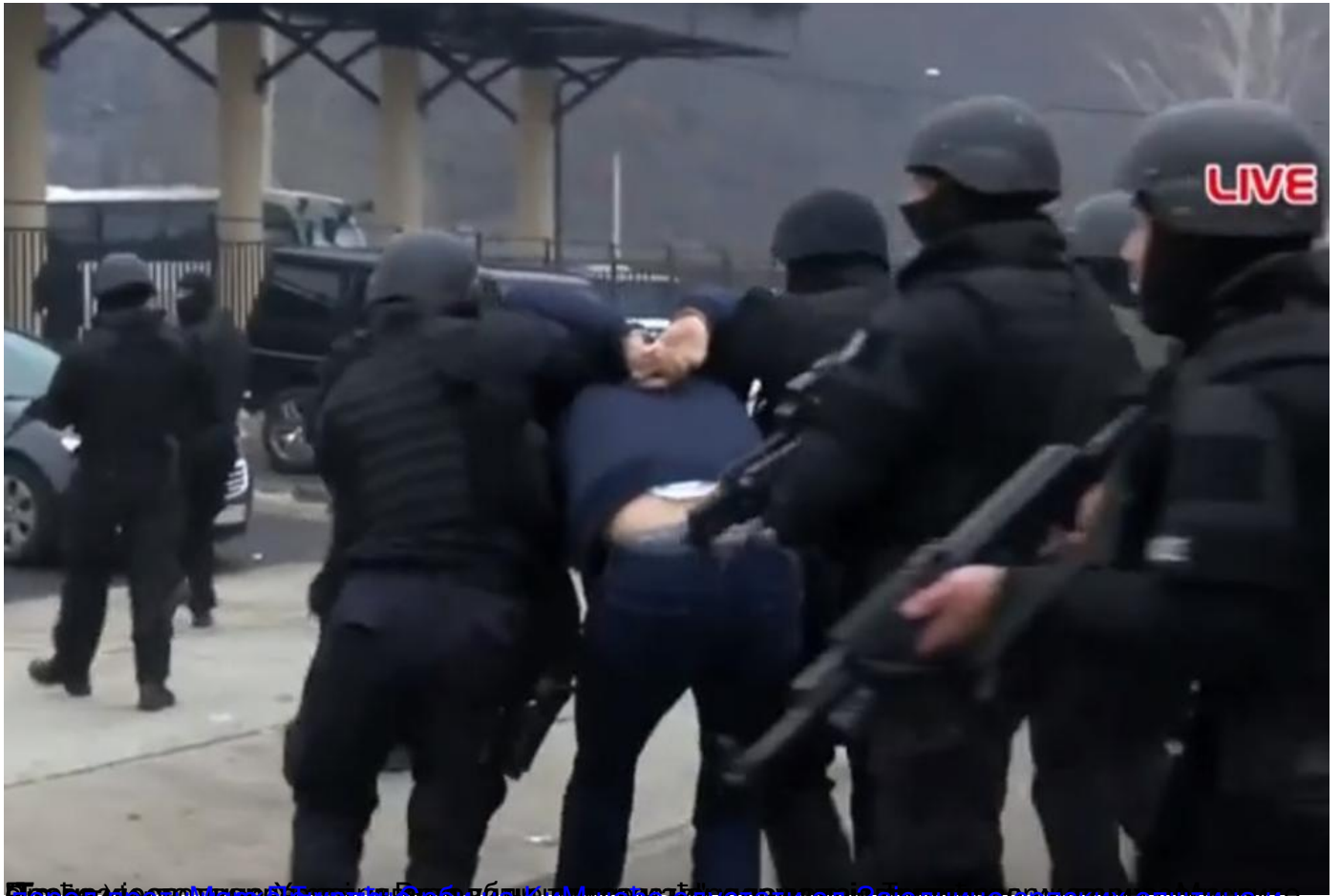
Блогер је оптужио да је Ђурић и Хоџа баш и Милошевић у одећи од Војводине притоком српских